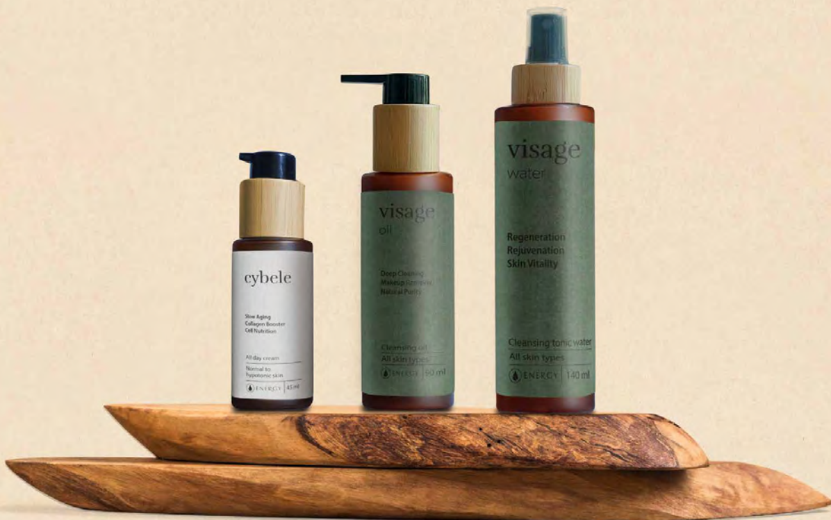
Visage oil (odličení), Visage water (tonizace, hydratace), Cybele (výživný anti-aging krém)

» Doplňující péče pro omlazení a rozzáření vaší pleti